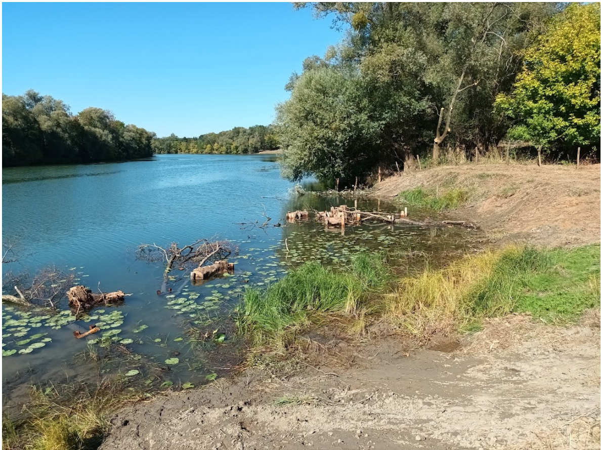
Photographie 4 : D'autres arbres ont été fixés en berge de la Saône pour créer des abris piscicoles