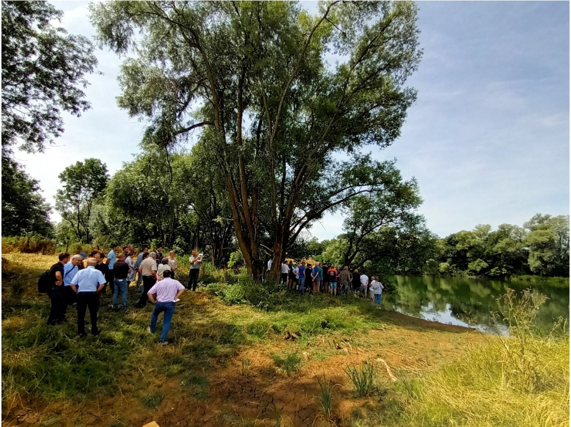
Photographie 5 : Visite de terrain au moment de l'inauguration des travaux