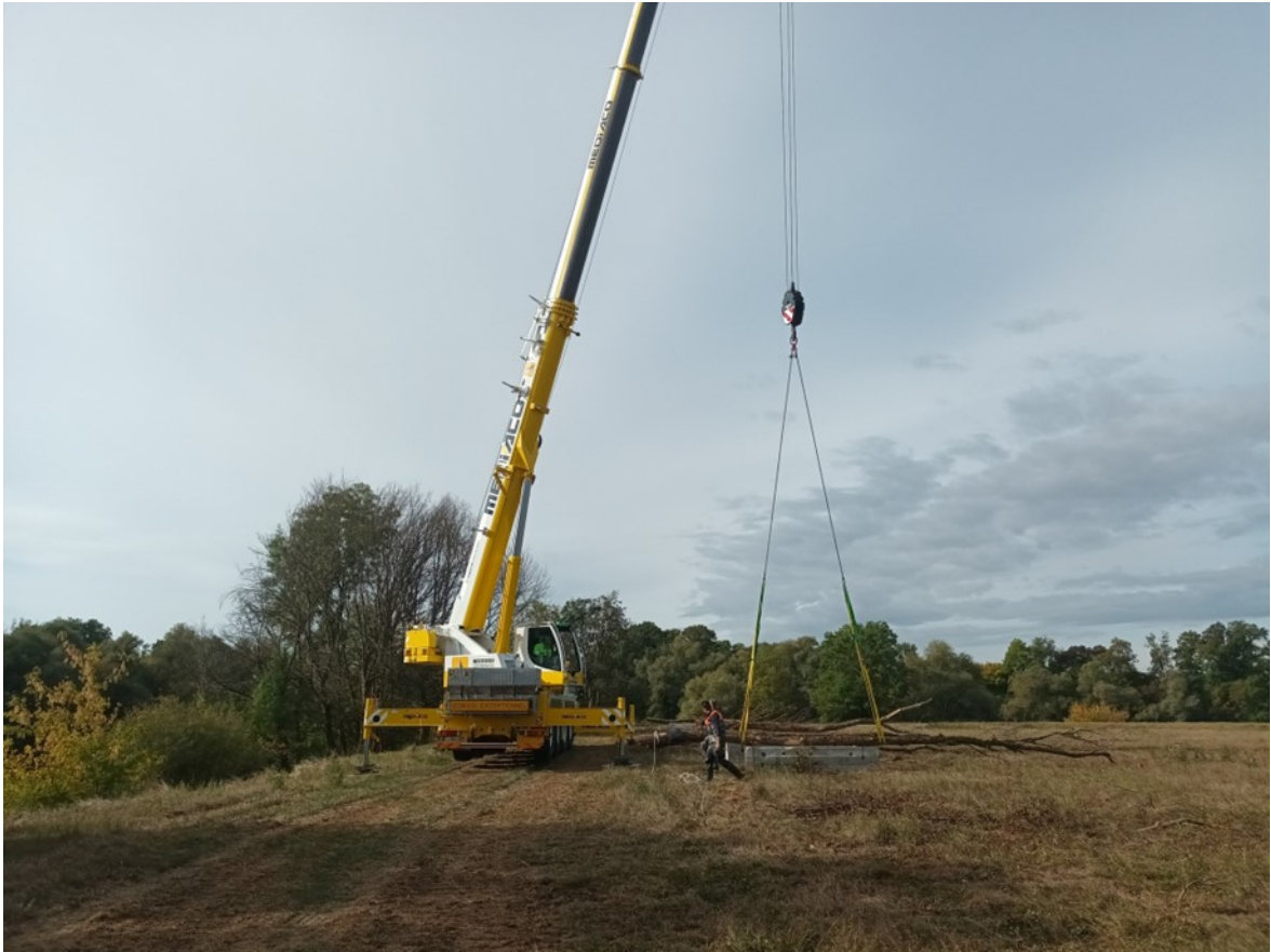
Photographie 3 : Des arbres ont été lestés puis immergés dans le lit mineur de la Saône pour créer des abris piscicoles