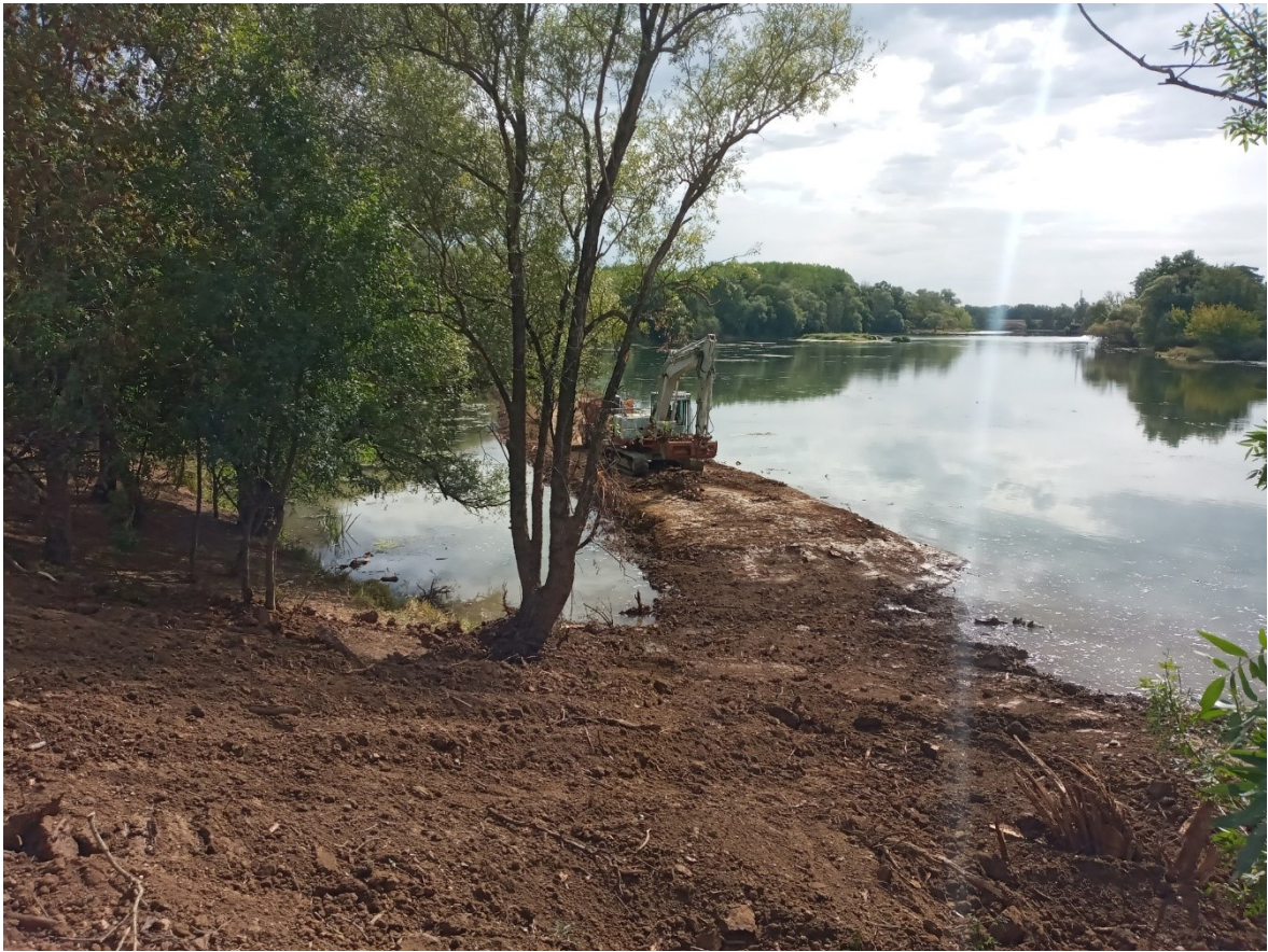
Photographie 1 : Création d'une annexe hydraulique de la Saône (la banquette sur laquelle l'engin est présent est submersible)