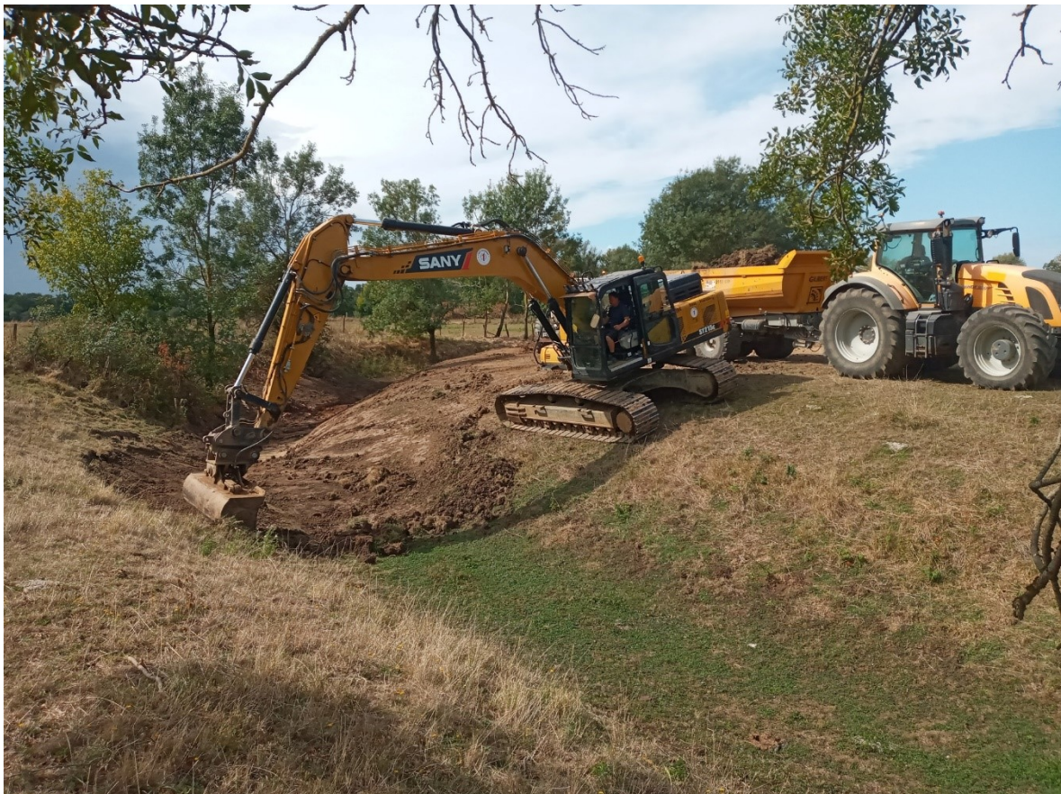
Photographie 2 : Terrassement en déblai du Bief du Triot en vue d'améliorer sa connectivité avec la Saône